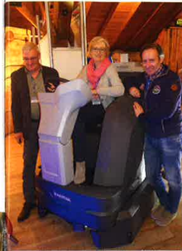
Probefahrten wie bei einem attraktiven Fahrzeugmodell auf der Automesse war bei der Nilfisk SC 6000 angesagt: Das Gerät sorgt für die effiziente Reinigung großer Flächen